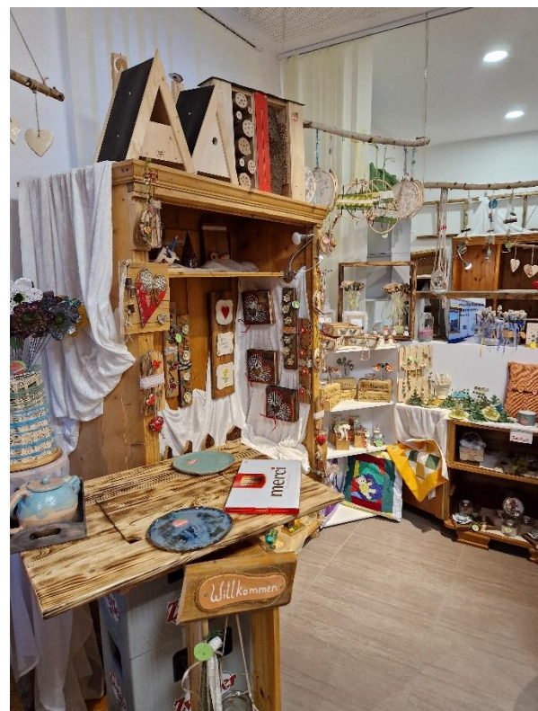
Ein interessanter und sehr informativer Nachmittag fand dann in unserem Klublokal sein Ende.